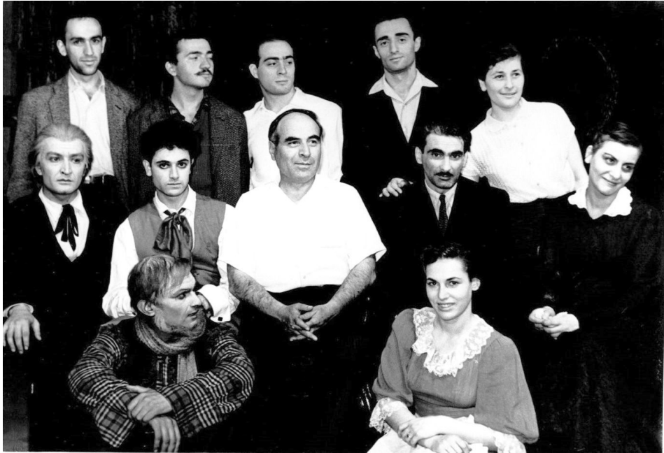
სამსახიობო ფაკულტეტის IV კურსის მეორე სადიპლომო სპექტაკლი გ. იბსენის „მოჩვენებანი“. დადგმა მ. თუმანიშვილის, 1958-1959 სასწავლო წელი. ჯგუფური ფოტო სპექტაკლის შემდეგ.