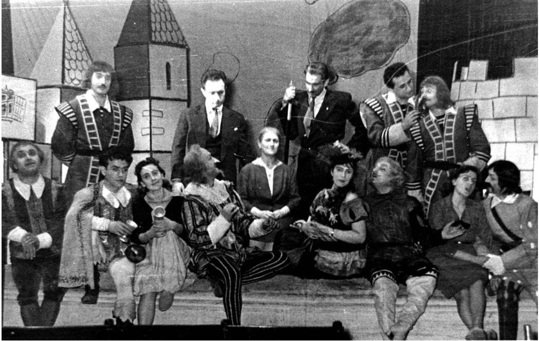
სამსახიობო ფაკულტეტის მუსიკალური განყოფილების IV კურსის საკურსო სპექტაკლი. ო'დარნის „მასკოტა“. დადგმა მ. თუმანიშვილის, 1959-1960 სასწავლო წელი.