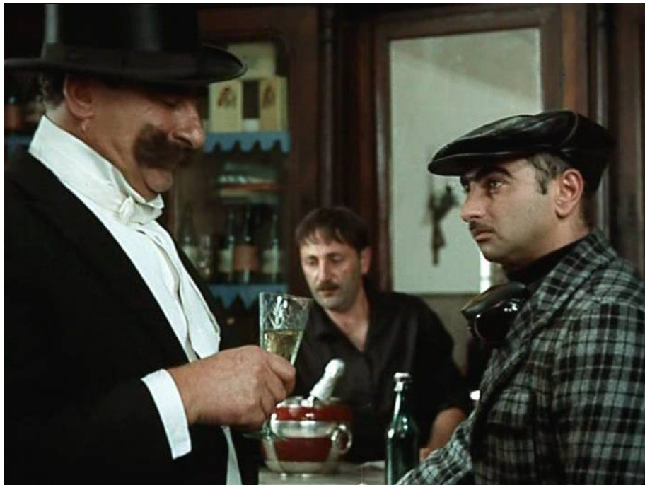
დოლო აბაშიძე და მერაბ კოკოჩაშვილი, კადრი გიორგი დანელიას ფილმიდან „არ დაიდარდო“ (1969)