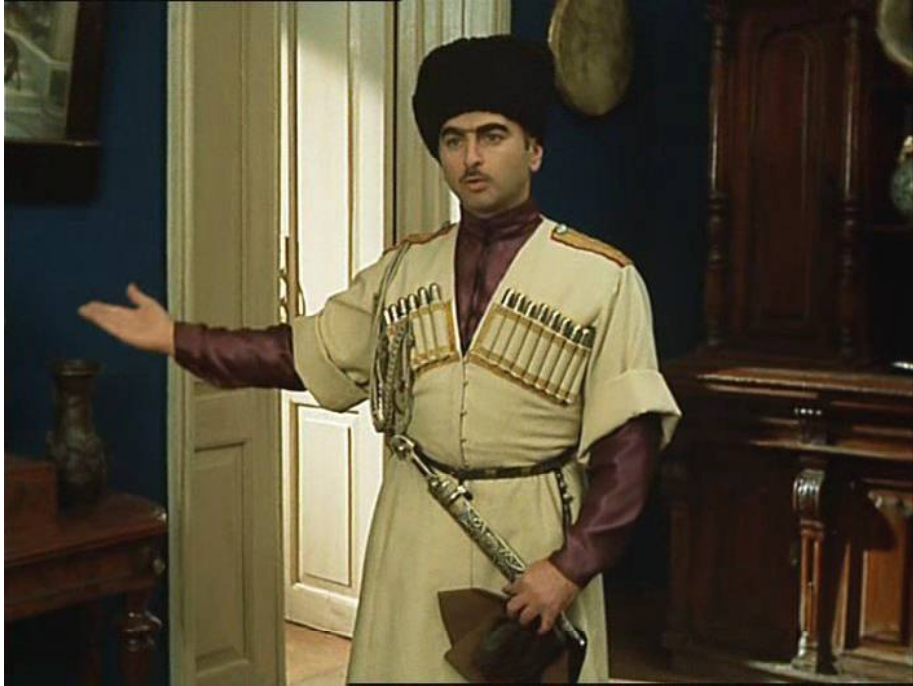
მერაბ კოკოჩაშვილი, კადრი გიორგი დანელიას ფილმიდან „არ დაიდარდო“ (1969)