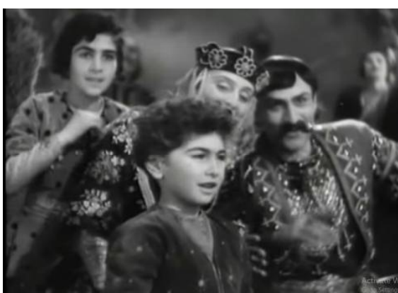
მერაბ კოკონაშვილი, კადრი მისიელ ჭიაურელის ფილმიდან „გიორგი სააკაძე“ (1942)